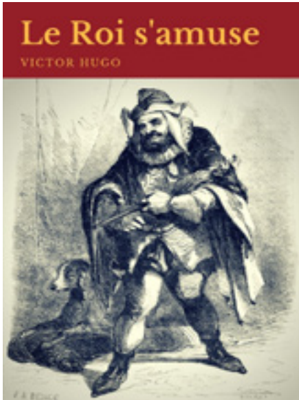
La obra inspiradora: Le Roi s'amuse

ginal de esta ópera como también el perfil asignado a sus personajes.