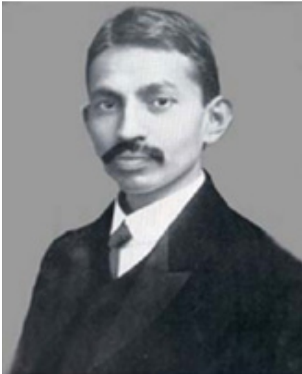
Gandhi en su juventud

Viajó luego a la India sólo para llevar a su esposa e hijos a Sudáfrica. A su regreso, en enero de 1897, un grupo de hombres blancos lo atacó y trató de lincharlo. Como clara indicación de los valores que mantendría por toda su vida, rehusó denunciar a sus atacantes, indicando que uno de sus principios era no buscar en los tribunales la reparación de daños contra su persona.