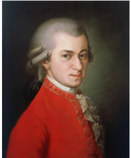
Wolfgang Amadeus Mozart

El estreno de "El rapto en el serrallo" (1782) ejerció un efecto fundacional, al abrir el nuevo rumbo que tomaría la ópera genuinamente alemana. Esta obra, encargada por la corte imperial, rompió con el convencionalismo y los dictámenes italianos que sustentaba el género, para aparecer bajo los moldes del singspiel, una variante germana de la ópera, enmarcada en los cánones de la comedia, con alternancia de partes cantadas y habladas, concebida con fines prioritarios de diversión popular y masiva.