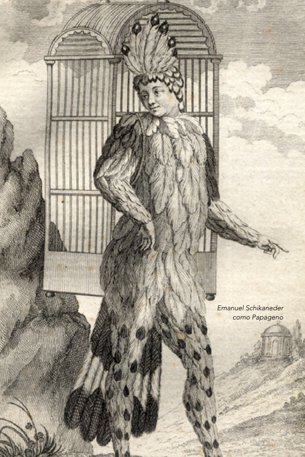
Emanuel Schikaneder como Papageno